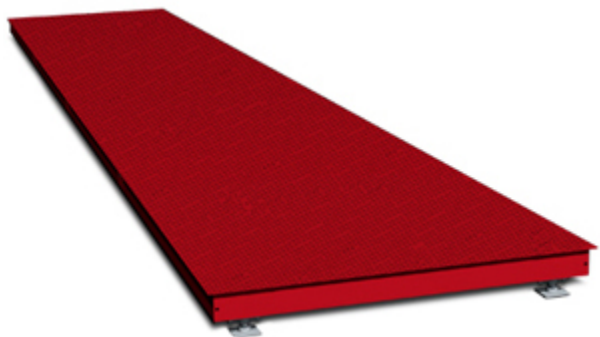
Pesa a ponte WBSAA